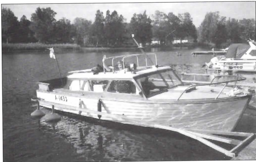
”Bruttan” (se text invid)

Tel. 040-5503013, E-post: bent.andersson@georgfischer.se