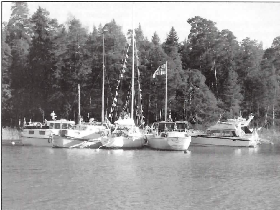
Det är trängsel vid bryggan på säsongsavslutningen

Vi hoppas att andra BNK-are också ställer upp i Emsalö-runt 2007 när denna möjlighet nu finns!