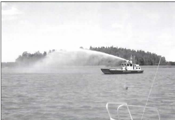
Bilder från Familjen- avigeringen:

Om vi nångång säljer eller byter Havis Amanda så kan det bli lite blött i ögonvrån.