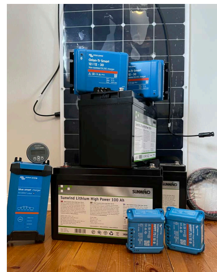
All utrustning samlad på ett och samma ställe innan montering.

När shoppinglistan var klar var det bara att börja googla fram produkterna. Igen kunde man konstatera att samma sak kostar olika mycket på olika ställen. Det förmånligaste priset på batterierna kom från Tuontitukku, DC-DC laddaren köpte jag från Suomen Akut, och resten av sakerna passade jag på att ta från Marinea då de hade båtmässerbjudande. Lönar sig säkert att redan på hösten lite börja fundera på att skaffa allt man behöver då man en gång gjort beslutet att uppgradera, för det kan finnas en risk att allt tar slut på våren, och kanske passa på att ta del av mässerbjudandena... Allt kablage och "småttplåtar" skaffades till största delen från den lokala Motonet-affären.