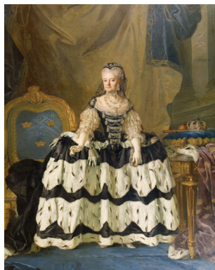
Lovisa Ulrika av Preussen, målad av Lorens Pasch dy